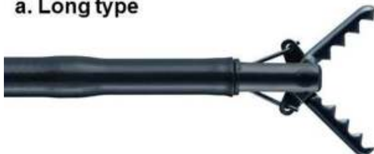
Clutch Cutter (FUJIFILM)