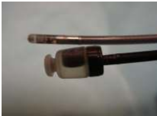
7.5MHz 先端挿入型プローブ (FUJIFILM)